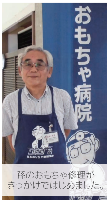
孫のおもちゃ修理がきっかけではじめました。

おもちゃ病院 にここ 日本おもちゃ病院協会、日本グッド・トイ委員会所属。 まなびの市民講師。兵庫県出身。温暖で住み良い環境に満足し昭和50年より茅ヶ崎に在住。