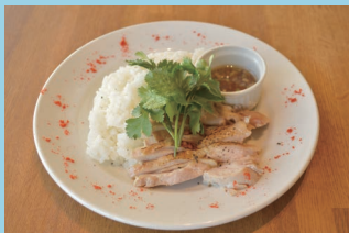
「カオマンガイ〜POEスタイル〜」 (新ランチメニューの一例です)

「冷やし中華はじめました。」 というには時期早々、なので POE では春の陽気が心地よくなってきた 4/4(月)より、【新】ランチメニューをはじめます。週変わりや日替わりを中心としたメニューに変更し、日ごとに変わる POE の新しい味をぜひお楽しみください。