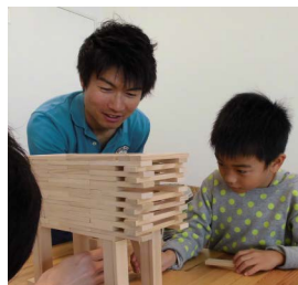
「楽しいことって夢中になっちゃう!!」だいたい月に1回ペースでまちスポ茅ヶ崎の机で遊んでいます。

愛知県出身。好奇心をくすぐる「楽しいあそび」を50種以上所有!アナログゲームや工作遊びなどで一緒に夢中体験したいなあ〜と活動中の『理学療法士×おもちゃインストラクター』。