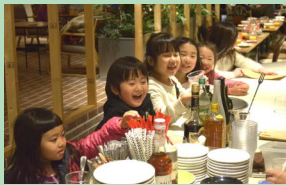
ある日のパーティー、飲み物を注文してワクワク顔!