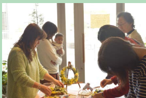
ある日のワークショップ、お子様をお客様同士が代わり番こに抱っこしてほっこり。

平日...9:00-21:00 土日祝...8:00-21:00※火曜休 L.O. FOOD...20:00、DRINK...20:30